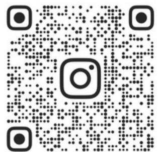
Link zu Instagram