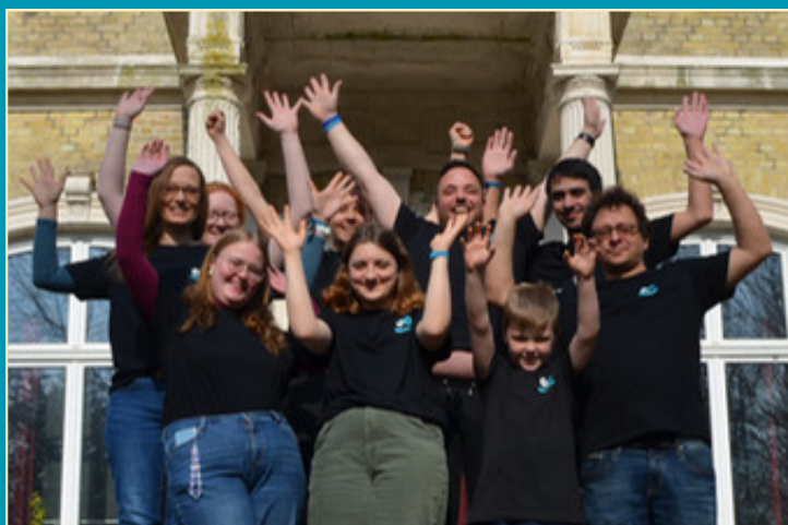
Das Team der Konfi-Freizeit 2024