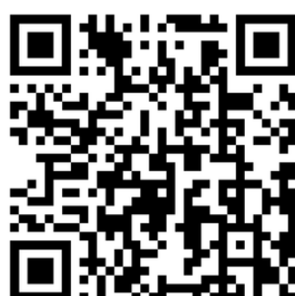
Angebote der Jugendarbeit